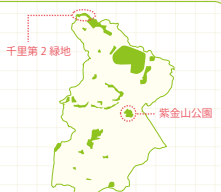
【吹田 コバノミツバツツジマップ】