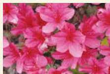
サツキ(別名:サツキツツジ) 吹田市民の花。花期は5~6月。