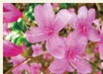
コバノミツバツツジ 漢字で書くと「小葉の三葉躑躅」。西日本で多く見られる。花期は3~4月

市内の里山に入ると「コバノミツバツツジ」を見ることが出来ます。紫金山公園が有名で、かつて満開のツツジが山を赤紫色に染めたことが「紫金山」の名前の由来とも言われています。市民団体による里山の保全活動も行われているおかげで、4月上旬になると美しい「コバノミツバツツジ」を見る事ができます。ほかほか陽気に包まれる頃、吹田のまちやうちでツツジが美しく咲き誇ります。鮮やかなツツジ色を感じてみましょう。