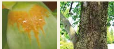
▲ オレンジの蜜のガイド ▲ 編みタイツのような樹皮マーク。蜜たっぷり！

いました。さすが子どもです。他にも「コウモリ」、「タリオネ」と言われ、想像をかきたてる葉のカタチをしています。中には小さい猫耳のような葉っぱもあって、萌えます。春に2つに折りたたまれた葉が開くところは、とてもかわいらしい風景です。この葉のカタチはとても特徴があるので探してみてください。