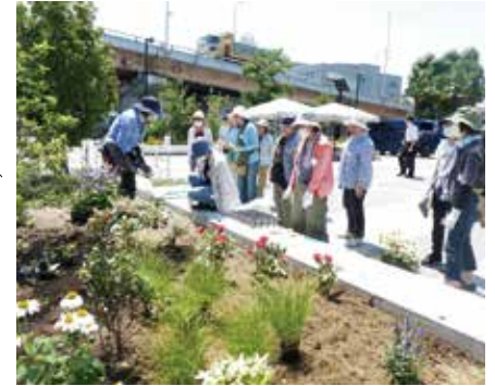
2年目となり花壇のエリアを拡大。