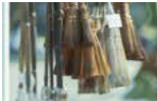
昔ながらの棕櫚製品の販売と手作り体験コーナー。