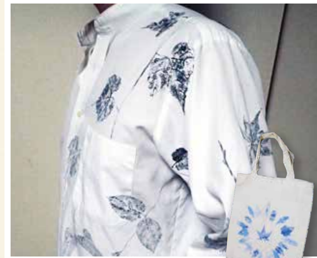
▲ ユリノキでなくても、葉っぱならなんでもよい。 ブドウなど葉脈がはっきりしている葉もおもしろい。

昔の人の知恵に学びつつ、今風にアレンジしたあそびをご紹介します。木とあそぶ体験がきっかけで、身近な木とともだちのような関係になれるかも。みどりを大切に思う気持ちがあなたの心に芽生えますように。