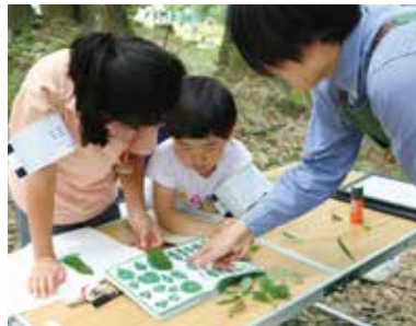
葉っぱから木の名前を調べました。

開催日: 2023年6月25日(日)、9月17日(日)、12月17日(日) 全4回