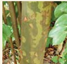
▲迷彩服のような樹皮