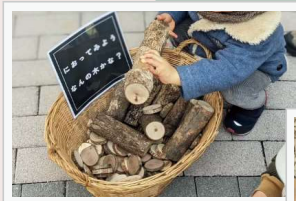
植物に詳しいスタッフが 教えてくれます

対象 / 未就園児の親子 時間 / 10:00 ~ 14:30 参加料金 / 無料