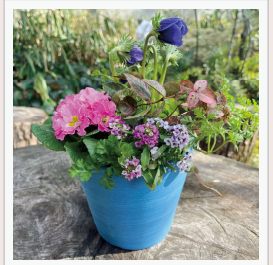
※花材と鉢はイメージです