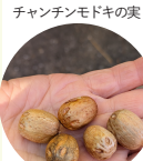
チャンチンモドキの実

大阪モノレール「阪大病院前」駅から徒歩約10分 大阪大学大学院薬学研究科附属薬用植物園