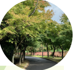
イロハモミジやトウカエデの遊歩道